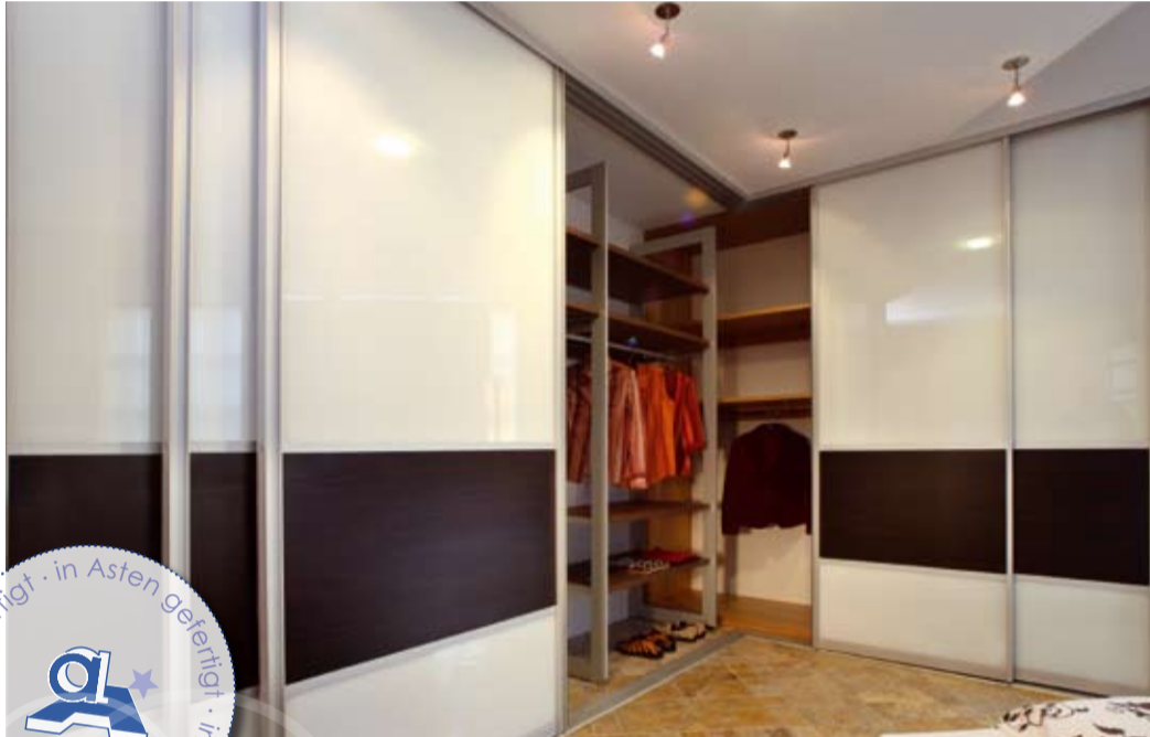
Begehbare Kleiderschrank mit Schiebetüren aus Spezial-Kristallglas, lackiert abgesetzt mit Finition-Holzfüllungen

Einfach die Schiebetür öffnen und einen eigenen Raum mit System erleben! Ausgestattet mit einem durchdachten Regalsystem, Kleiderstangen und Schubladen, mit Spiegel und Ablagen für Accessoires - begehbare Kleiderschränke bieten gerade auch in kleineren Schlafzimmern ein Optimum an Raumgestaltung und Raumausnutzung. Auf Maß gefertigte Elemente millimetergenau in den vorhandenen Raum eingepasst, eröffnen unendliche Weiten. Zeit sich zu verlieben!