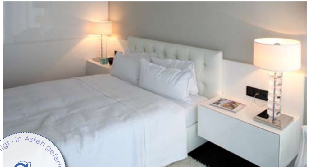
Jugendzimmer aus Parapan-Acrylwerkstoff in Hochglanz weiß, Kopfteil Leder, Boden Räumereiche

Ästhetik und optimal Funktionen machen damit Ihren Schlafzimmertraum wahr. Lassen Sie sich von uns in die Welt tausend und einer Lösungen entführen. Wir beraten Sie gerne!