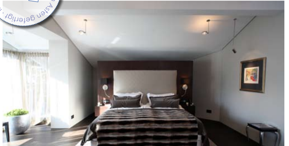
Elternschlafzimmer in Nussbaum gebeizt mit Leder Rückteil, Nachttische stumpfeinschlagend, Boden Räumereiche