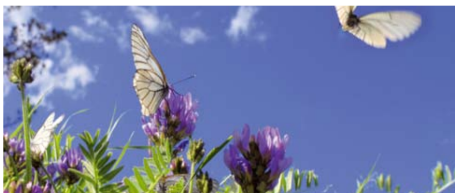
Ein froher Sinn ist wie der Frühling. Er öffnet die Blüten der menschlichen Natur. (Jean Paul)

Wohndesign in seiner schönsten Form. Stilsicheres Design trifft edle Hölzer. Eine Kombination, die Träume wahr werden lässt. Jahrelange Erfahrung, das Wissen um die Macht der Nuancen und echtes bayerisches Schreinerhandwerk sorgen dafür, dass Möbel aus dem Hause Asenkerschbaumer mehr sind als bloße Einrichtungsgegenstände. Schaffen Sie mit uns gemeinsam eine Atmosphäre, die Stil und Gemütlichkeit, Raffinesse und Ästhetik miteinander vereint. Denn sind es nicht die Details, die Gutes perfekt machen?