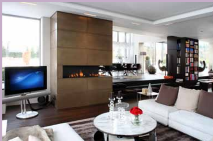
Schmuckstück und Unikat: Wohnraum mit Säulenregalen und edler Kaminverkleidung in Bronze-Metallhaut.