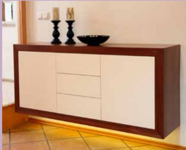
Elegant: Hänge-Sidebord in Weißlack mit Nussbaum-Passepartout, grifflos mit Bodenunterleuchtung.