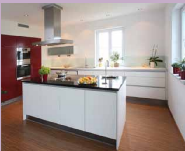
Kochvergnügen: Moderne Einbauküche in Satinlack und Edelgranitplatte - mit zweitem Spülbecken auf der Kochinsel.