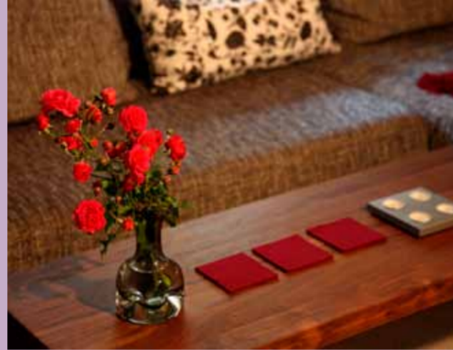
Wohlfühlmosphäre pur: Nussbaumcouchtisch mit einmaligen Akzenten.