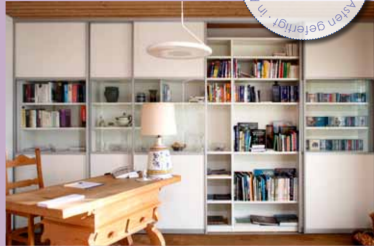
Weiß in Bestform: Nischen-Gleitürschrank mit Schauvitriolen - Stauraum ohne Ende.