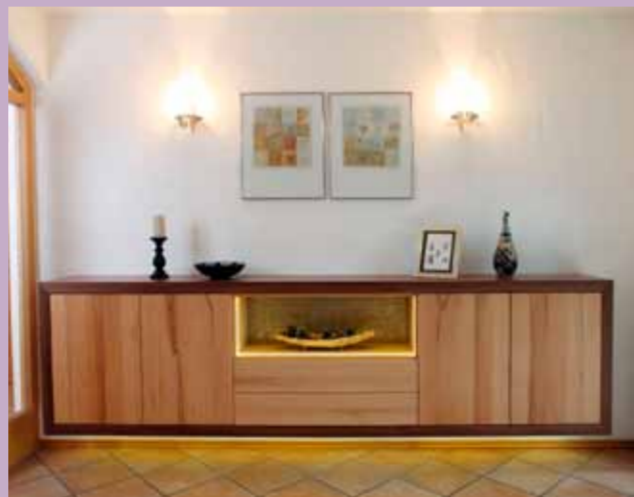
Hingucker: Hänge-Sidebord in massiver Kernbuche mit Nussbaum-Passepartout, grifflos mit Nischen-LED-Beleuchtung und Relief-Rückwand.